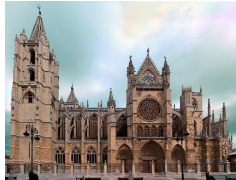
Catedral de León