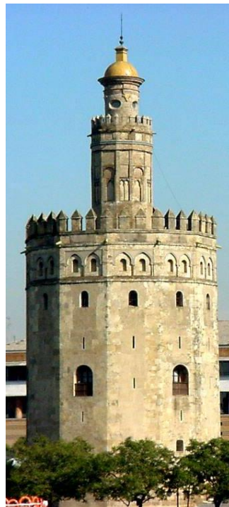
Torre del Oro